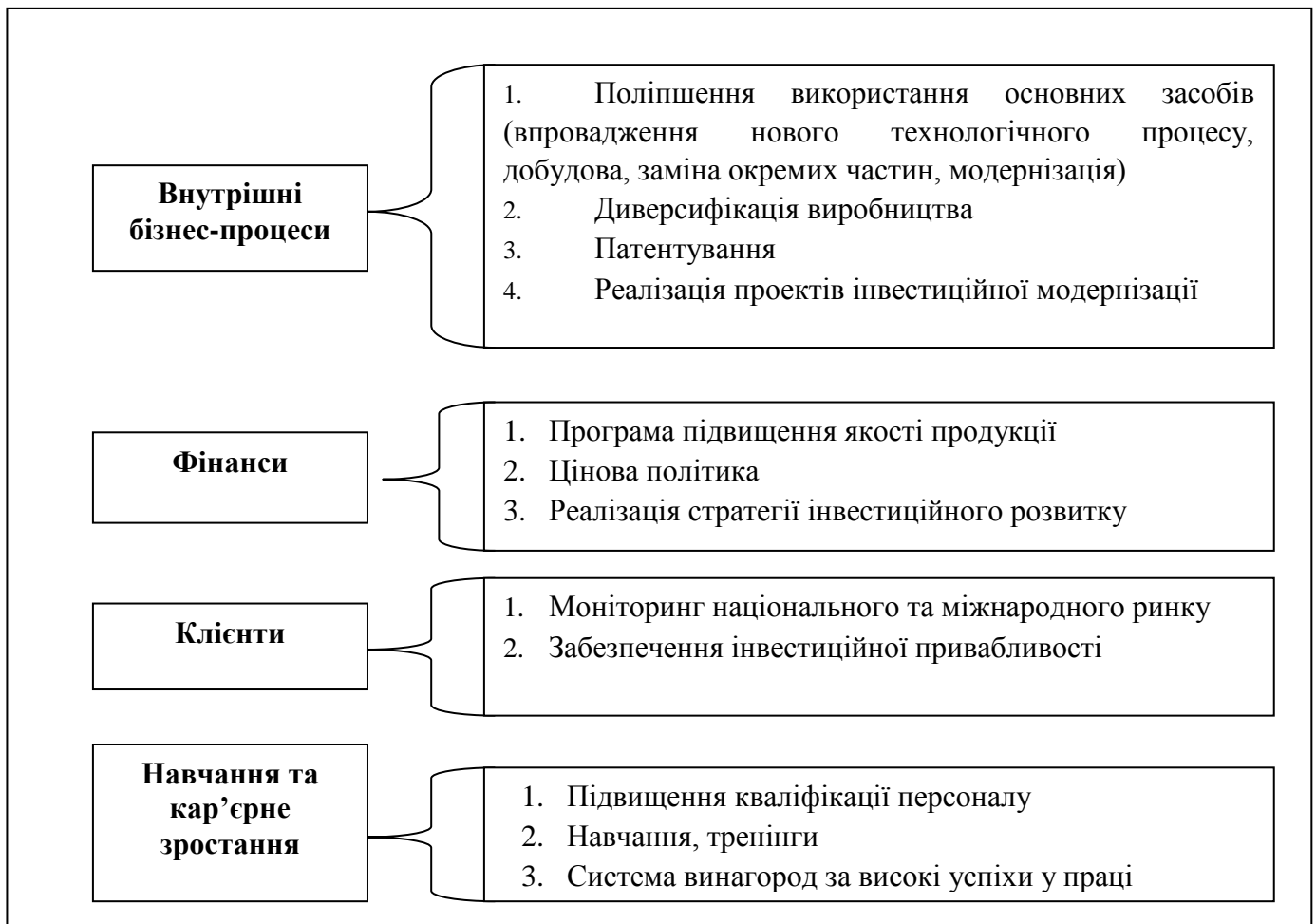
Рис. 3. Стратегічна карта інвестиційного розвитку ТДВ «Стрий-Авто»

Розроблено стратегічну карту інвестиційного розвитку для ТДВ «Стрий-Авто», яка відображає пріоритетні напрямки розвитку, зокрема реалізацію проектів інвестиційної модернізації та стратегії інвестиційного розвитку, забезпечення інвестиційної привабливості та підвищення кваліфікації персоналу (рис. 3).