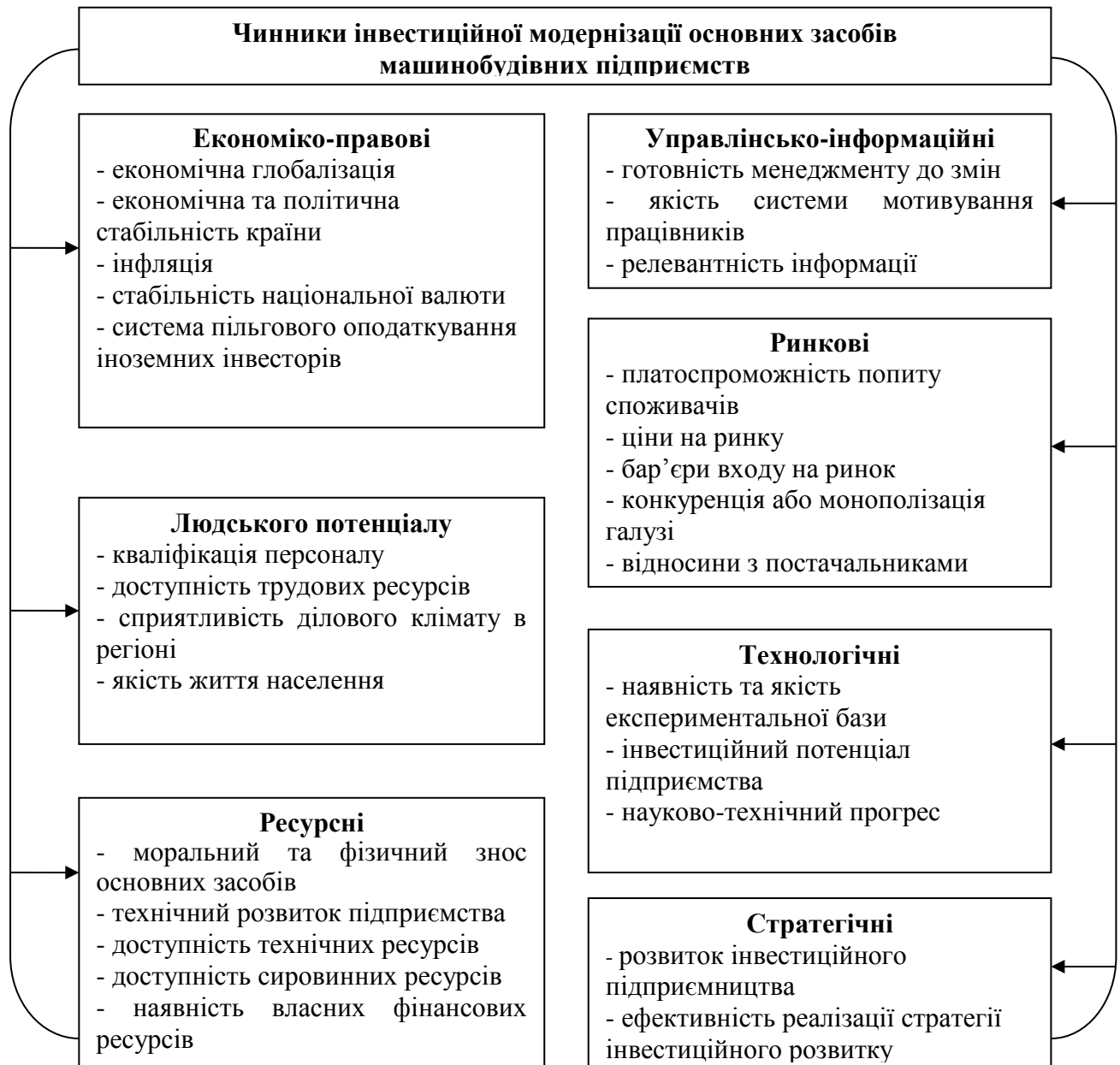
Рис. 2. Класифікація чинників інвестиційної модернізації машинобудівних підприємств

Результати вивчення діяльності вітчизняних підприємств щодо здійснення ними поліпшень основних засобів дають змогу стверджувати, що чинники, які сприяють інвестиційній модернізації, мають різний характер. Сукупність перелічених чинників можна подати у вигляді класифікації, зображеної на рис. 2.