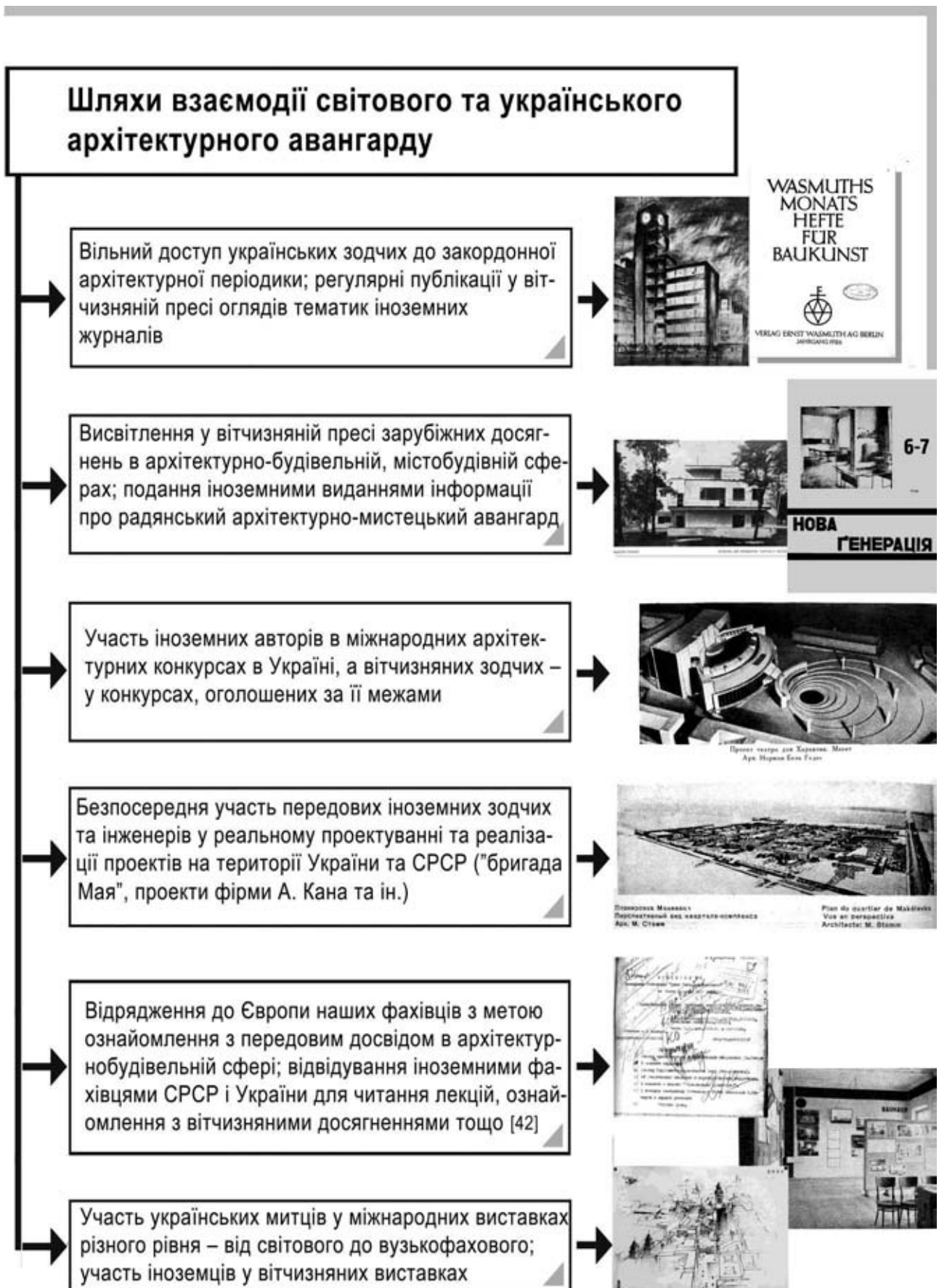
Рис. 1. Шляхи взаємодії світового та українського архітектурного авангарду.