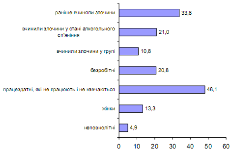
Розподіл окремих категорій осіб, виявлених правоохоронними органами у 2013 році (%)

Аналіз матеріалів кримінальних проваджень засвідчив, що більшість розглянутих злочинів (47,1%) припадає на нічний час доби (з 24.00 до 06.00