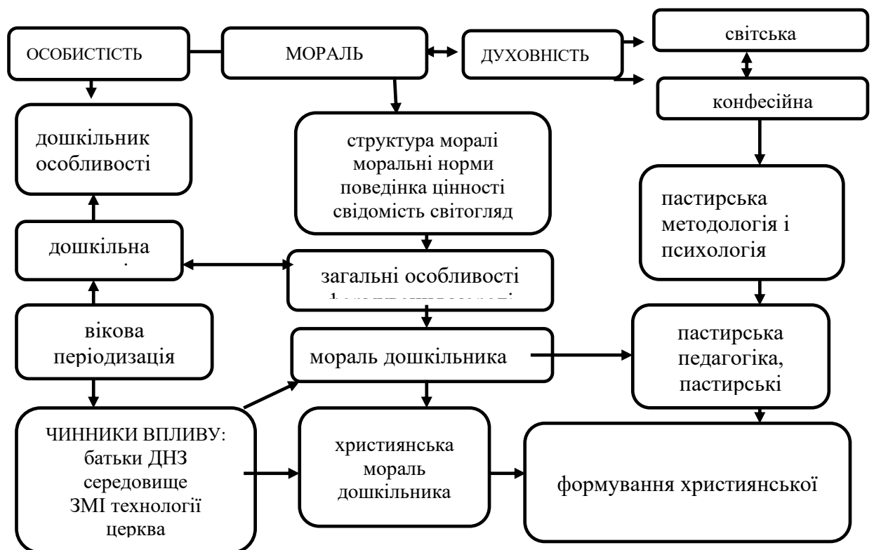
Рис. 1.2. Узагальнена схема розвитку моралі дошкільника

для кожної дитини «індивідуального освітнього маршруту на основі урахування різноманітності змісту, форм і методів роботи з нею; забезпечення соціального захисту від некомпетентного педагогічного впливу» (Дошкільна Освіта, 2010, с. 293). Згідно зі статтею 4 Закону України «Про дошкільну освіту» (2001) дошкільна освіта – обов’язкова первинна складова неперервної освіти в Україні.