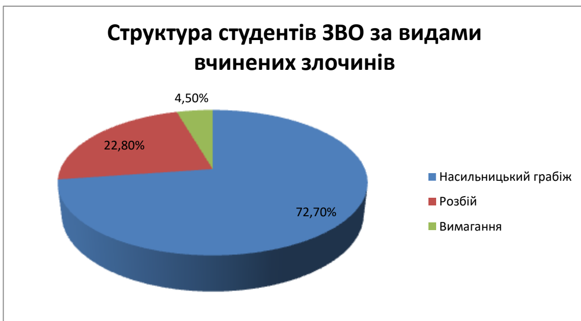
Рис. А.3 Структура студентів ЗВО за видами вчинених корисливо-насильницьких злочинів проти власності з 2004 по 2018 рр.