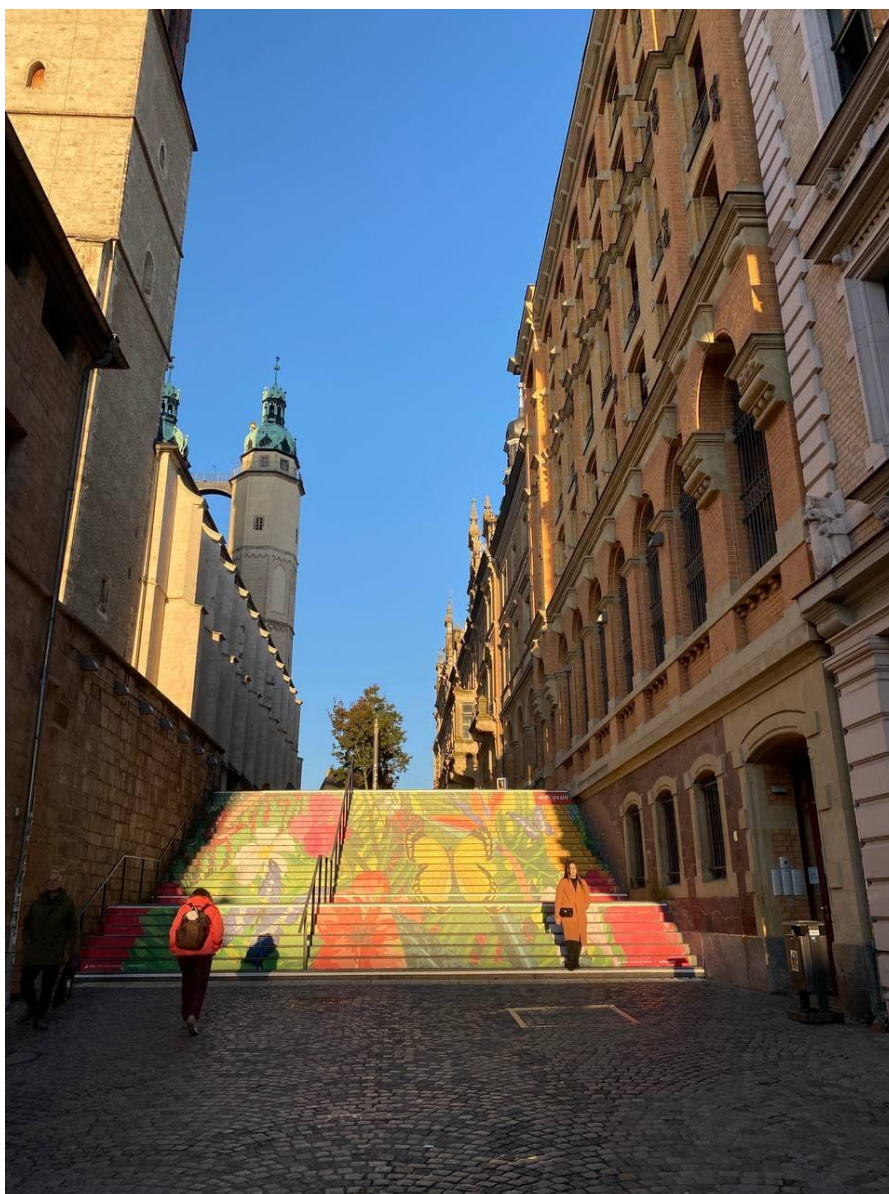
«Дорога в краще майбутнє»

Після завершення презентації, ми вирушили у корпус, де знаходиться філософський факультет, та попали на виставку археологічних знахідок та інших старожитностей. На виставці можна було побачити вбрання ректора та клейноди, які вони носили в честь свого статусу та носять зараз. Також на виставці можна було побачити багато різних астромічних приладів. В іншому залі було представлено різні археологічні знахідки та корисні копалини. Також там був стенд з розміщеними маленькі брусочки торфу, які колись доставляли на вагонетках з шахти. В кінці дня ми ознайомились з архітектурою міста та побачили місцеву ратушу.