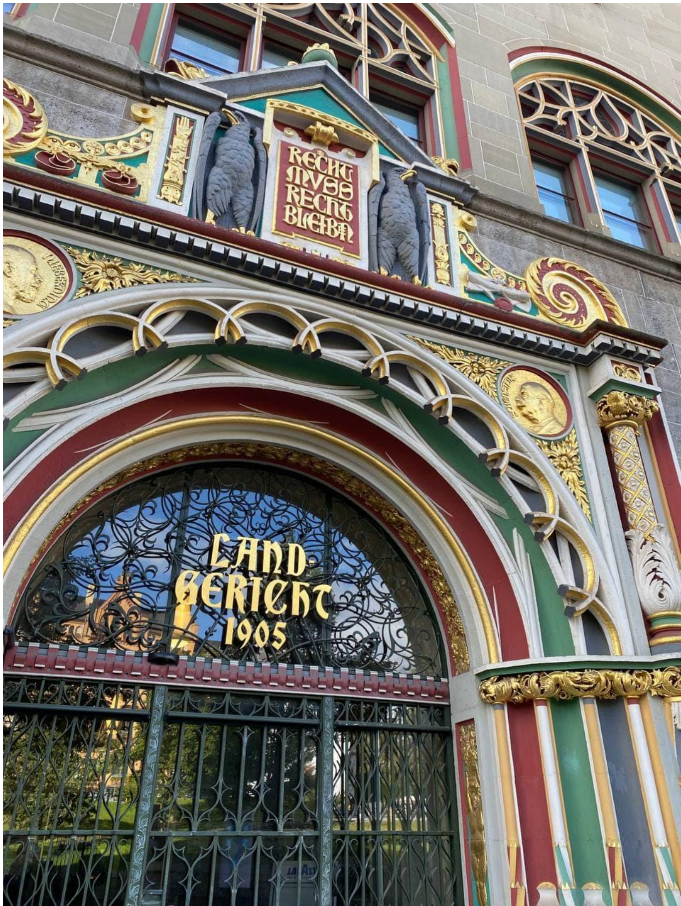
«Місце де вирішують долю»