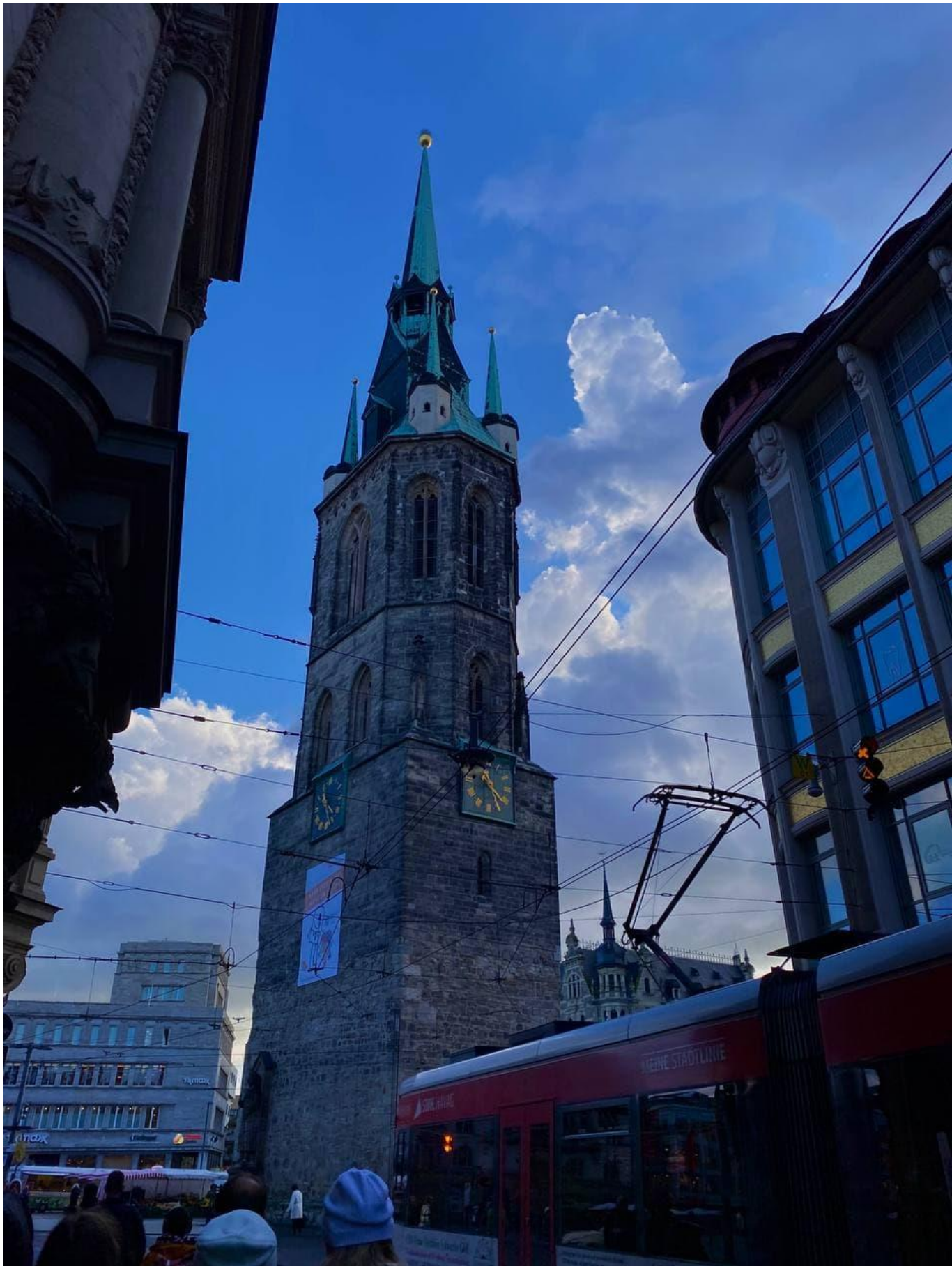
«Ратуша і львівський трамвай»