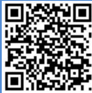
Сторінка кафедри на facebook