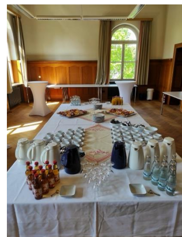
Рис. 3. Перекус.

І на завершення запрошені представники відділу поліції розказали про напрямки, терміни та програми навчання.